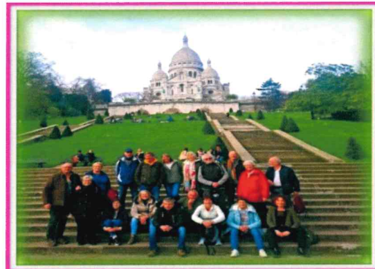
Sur les marches du Sacré Coeur